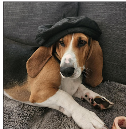
Urax de Lo de La.

För att få avelsrekommendation i Sverige gäller max tre kullar i Sverige och Norge, med registreringssiffrorna som bakgrund är även detta "för mycket". Vi står inför en mycket problematisk situation gällande vår avelsbas. För den som undrar varför vi räknar med norska hundar också så är det så att vi har "ungefär samma hundar – samma avelsbas" förutom några obesläktade importer. Vi har ju under många år haft lätt att importera över gränsen och importer mellan Sverige och Norge har skett under många. Vår lilla avelsbas är ett problem som vi behöver arbeta med och ta hänsyn till inför skrivande av vårt nya rasdokument (RAS). Så med detta som bakgrund önskar vi fler obesläk-