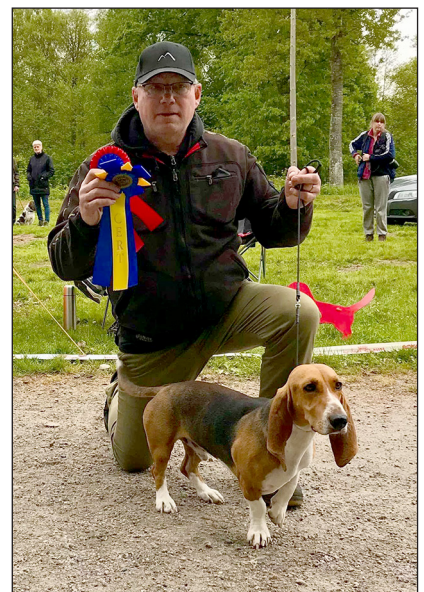
Granareds Pompe – certvinnare.

SBaK arrangerar officiella utställningar för alla Bassetraser. De är trevliga lokala arrangemang. I nordöstra lokalavdelningen, som också är den största har man valt att arrangera tre samverkas/samarbetsutställningar med