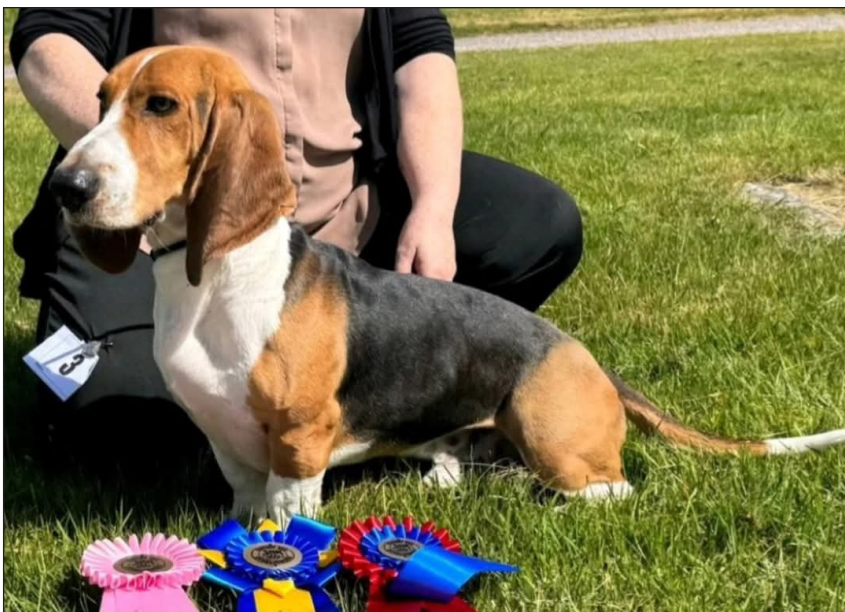
Kullalyckans Primo – certvinnare.

övriga jakthundklubbar. Dessa har varit på Gotland, i Östersund och i Alfta. Dessa arrangemang är väldigt trevliga med chans att se övriga jakthundsraser. Synd bara att så få BAN deltar – tre på Gotland, ingen i Östersund och bara en i Alfta. Jag har själv deltagit både på Gotland och i Alfta och kan verkligen rekommendera dessa utställningar till nästa år. Än finns det tid att meriterna hunden på utställning, gå in på SBaKs kalender och läs mer https://sbak.se/kalendarium-inkl-utställningar/ . Hittills i år har tre hundar premierats med utställningscertifikat: Motvindens Wilson, Kullalyckans Primo och Granareds Kling. En fin start mot ett kommande utställningschampionat!